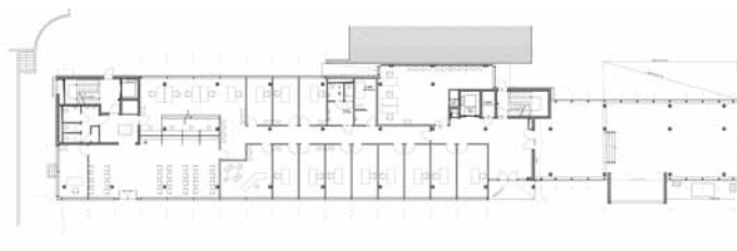
Rez-de chaussée, bât. 0