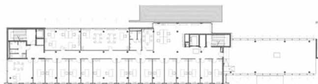
1er étage, bât. 0